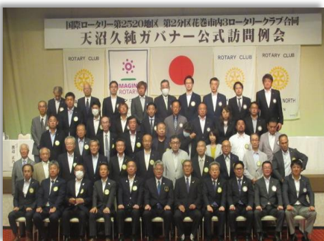
市内 3RC 記念撮影